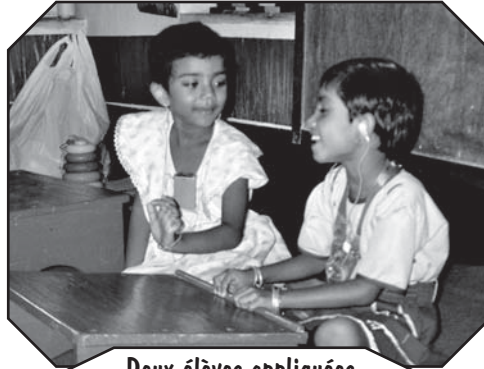
Deux élèves appliquées

Dans le district de Hooghly à l'ouest de Kolkata, dans cette région économiquement pauvre, l'association Mukhadara persévère dans son travail, ceci grâce au soutien de MIBLOU. 329 enfants handicapés de 0 à 18 ans bénéficient de soutien et de conseils dans divers domaines: intégration dans le système scolaire, aides diverses, physiothérapie, appareils orthopédiques, auditifs et lunettes. Des formations professionnelles et des petits crédits permettent aux jeunes adultes d'ouvrir une échoppe ou un petit atelier.