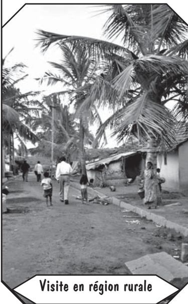
Visite en région rurale

Avec l'aide partielle de MIBLOU, "Gramina" a aussi entrepris la construction d'un petit centre de réhabilitation. Ce centre servira, entre autres, à la physiothérapie, à la fabrication d'appareillage orthopédique, à des réunions diverses, médicales, sociales et économiques. Leur travail au sein des villages n'en sera que mieux organisé et géré.