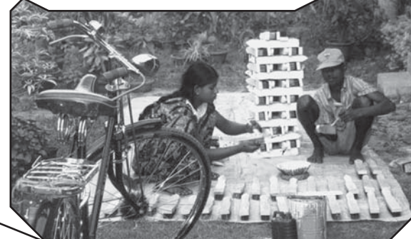
Fabrication de brosses à la maison

Malheureusement, une grande majorité de la population handicapée est ignorante de ses droits, et ce n'est que grâce à des associations comme celle-ci que certains droits leur sont enfin acquis. Une autre activité de cette association est d'organiser de petits ateliers, afin que les jeunes filles souffrant de troubles mentaux puissent apprendre la fabrication de brosses métalliques, et recevoir un micro-crédit afin de démarrer cette activité individuellement chez elles, avec le soutien de leurs parents.