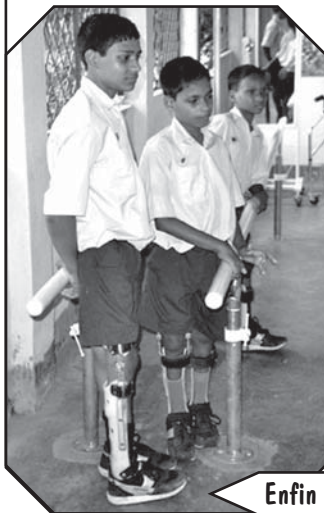
Enfin bien équipé !

Début 2004, il fut nécessaire de rénover et restructurer cet atelier avec du matériel neuf et mieux adapté aux techniques de travail d'aujourd'hui.