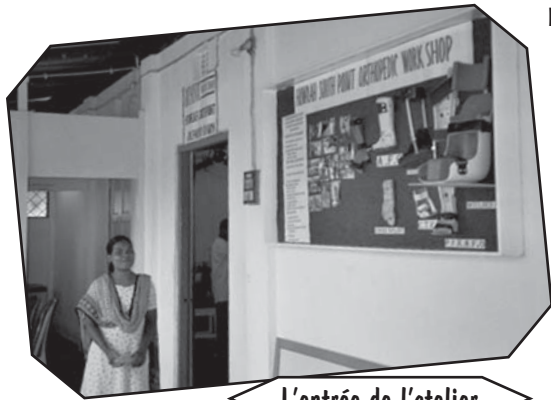
L'entrée de l'atelier

En 1992, MIBLOU créa son tout premier atelier orthopédique, dans le centre de Mogradanghi, un home et une école pour des enfants handicapés, surtout par des séquelles de polio.