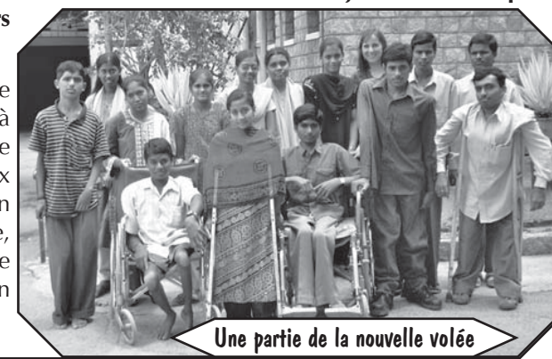
Une partie de la nouvelle volée

MIBLOU est très satisfait de ce succès et l'expérience est déjà renouvelée avec une nouvelle volée de 25 élèves. Ils auront, eux aussi, la chance d'apprendre un métier afin de gagner un salaire, ce qui leur ouvrira la porte de l'indépendance et prouvera qu'un handicap peut être surmonté.