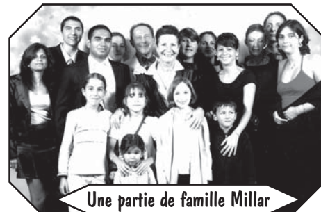
Une partie de famille Millar

Chaque organisation a son directeur et du personnel exclusivement indien et reste en contact permanent avec le Comité de MIBLOU à Genève grâce aux moyens de communication moderne. MIBLOU est officiellement reconnu d'utilité publique en Suisse et en Inde.