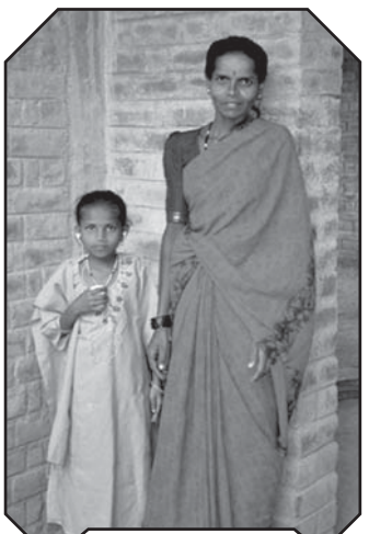
Fière de son nouvel appareil auditif

"Gramina" a aussi créé un foyer dans une petite maison de village pour les plus grandes filles à mobilité réduite habitant trop loin de l'école. Elles y sont en sécurité loin des abus divers qu'elles pourraient subir. Leur taux de réussite scolaire est positif et leurs familles se rendent enfin compte qu'il est important d'éduquer une fille pour faciliter son indépendance future.