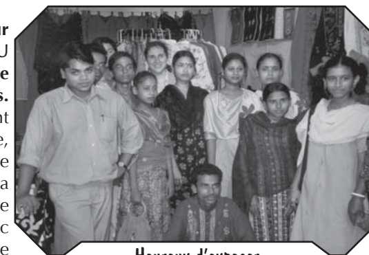
Heureux d'exposer et de vendre leur produit

Dans le cadre des formations pour jeunes adultes handicapés, MIBLOU a financièrement soutenu le projet de Sanchar ces trois dernières années. Une quinzaine de jeunes, souffrant principalement de déficience auditive, ont appris les différentes techniques de broderies et de couture. Aujourd'hui la qualité de leur travail est remarquable, ce qui leur permet la commercialisation avec succès. Ce groupe va pouvoir former une coopérative avec le soutien de quelques parents et continuer ainsi sur sa lancée de façon autonome. Parallèlement une nouvelle équipe va bénéficier de la même formation et pourra rejoindre la coopérative dans quelques années.