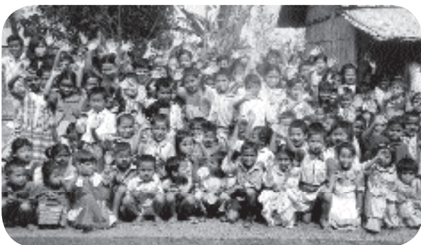
Au revoir et merci...

En 1989, MIBLOU annonçait l'ouverture du Marika Day Care Centre. 10 ans ont donc déjà passé ... Le but est atteint : en l'an 2000 cette école va prendre son envol vers l'indépendance. Grâce à votre fidèle soutien, MIBLOU a permis à ces filleuls "hors caste" d'étudier, de manger à leur faim (250'000 assiettes remplies!) et de recevoir les soins nécessaires et indispensables à leur bon développement moral et physique. MIBLOU leur souhaite à tous un bel avenir.