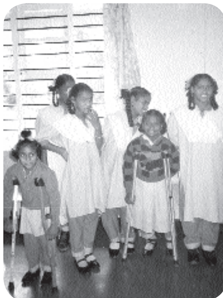
Merci de nous faciliter la vie...