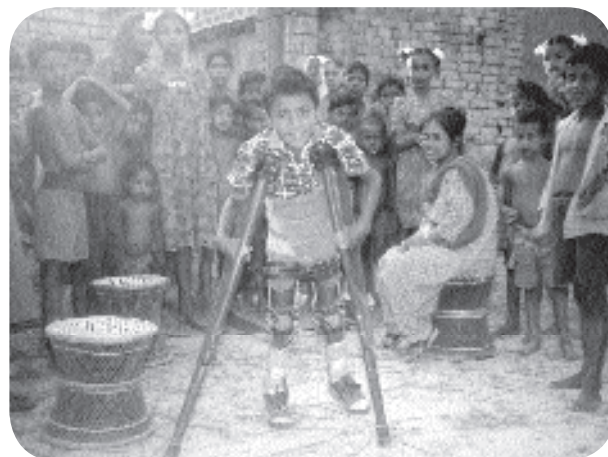
Retour au village ...

Pour RCFC l'an 2000 sera l'année du renouveau.